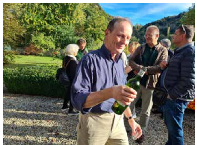
Ein sehr gastfreundlicher Schlossherr.