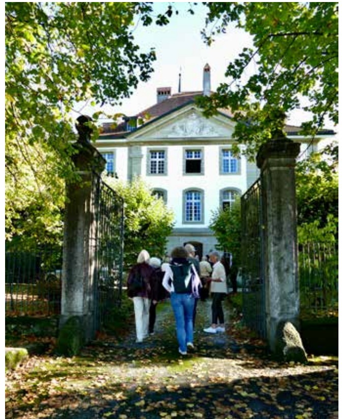
Der Eintritt in das Schlossgelände.