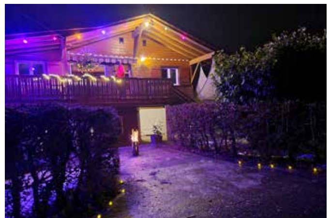
13. Dezember 2023, 17:45 Uhr. Alles ist bereit, um die mutigen Menschen zu empfangen, die der Kälte trotzen!