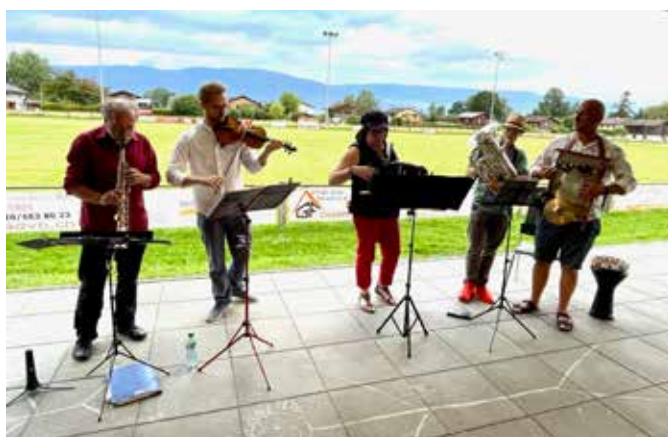
En musique avec le groupe Hotegezugt Quintet.